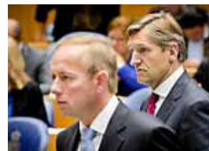
Kees van der Staaij.

Reclames van datingsites als Second Love moeten voorzien worden van een waarschuwing: 'Let op. Vreemdgaan dupeert kinderen'. SGP-leider Kees van der Staaij vindt het 'bizar dat dit soort reclame geen strobreed in de weg wordt gelegd'. Een dergelijke vorm van betutteling pas echter niet in deze tijd. Websites zijn er bovendien niet verantwoordelijk voor dat mensen vreemd gaan. Stem en reageer op onze website