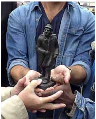
Het gekozen beeldje.

In zijn boeken was Baantjer van 'weinig of geen geweld en niet vloeken'. De praktijk bleek iets minder braaf. Zie de wapens in het museum en bedenkt dat dertig jaar terug jaarlijks alleen al zo'n veertig heroïnedoden werden gevonden in de rosse